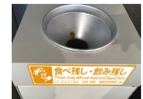
食べ残し・飲み残し