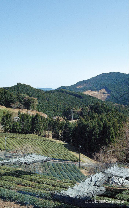
ヒラシロ遺跡からの眺望