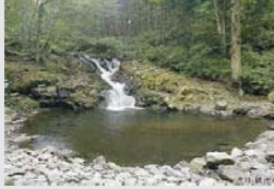
※写真は「サブコース③三國山ブナ林」です。

又、地藏堂川には「銚子ヶ淵の花嫁」、「椿ヶ淵」など色々な伝説もあり、こうした昔話を思い浮かべての散策も又楽しみが増します。