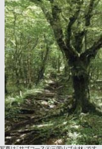
※写真は「サブコース③三國山ブナ林」です。