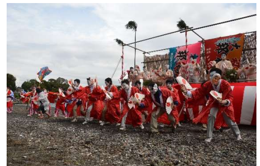
大瀬崎での勇み踊り