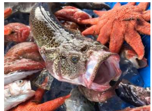
水揚げされる深海魚