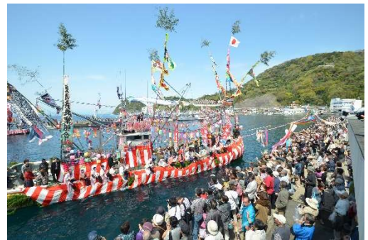
内浦漁港での踊り船パレード

また、内浦漁港では、踊り船のパレードや魚介類の販売などが行われる内浦漁港祭が開催されます。