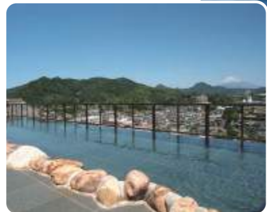
伊豆長岡温泉 / 伊豆の国市 MAP⑦ 伊豆

港まち焼津に噴き出した歴史の浅い温泉ながら、「温泉総選挙」で5年連続リフレッシュ部門全国1位を獲得。1900万年前の地層から湧き出す温泉を地下1,500mから汲み上げた温泉成分豊富な湯です。 焼津市栄町1-2-14 焼津市観光協会 ☎ 054-626-6266 JR焼津駅下車すぐ