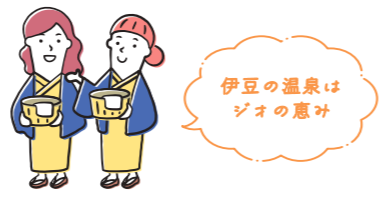
堂ヶ島温泉 / 西伊豆町 MAP⑩ 伊豆

西伊豆のある特徴的な自然景観が際立つ温泉地です。奇岩や海に沈む夕日を望む露天風呂が魅力。硫酸塩泉が特徴で、体の芯から温まります。 西伊豆町仁科2910-2 西伊豆町観光協会 ☎ 0558-52-1268 伊豆急行伊豆急下田駅からバス「兼浜」下車、徒歩約6分