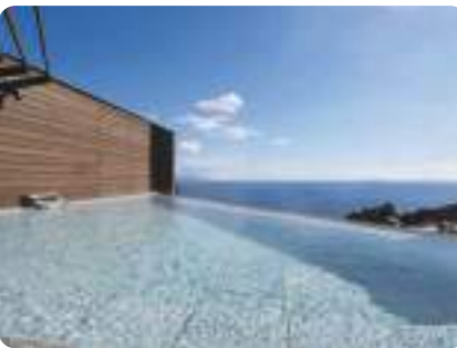
熱川温泉 / 東伊豆町 MAP⑧ 伊豆

伊豆半島の南端にある海と歴史に包まれた温泉地です。蓮台寺温泉、河内温泉、白浜温泉、相玉温泉、観音温泉が点在し、豊富な湯量を誇ります。単純泉やアルカリ性泉が中心で、美肌効果も期待できます。 下田市外ヶ岡1-1 下田市観光協会 ☎ 0558-22-1531 伊豆急行伊豆急下田駅から徒歩約15分