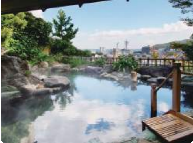
伊東温泉 / 伊東市 MAP⑥ 伊豆

平安時代に発見されたといわれ、江戸幕府3代将軍徳川家光にも献上していた由緒正しい温泉の湧出量は全国有数(県内随一)を誇る。多くの文人墨客にも愛された風光明媚なロケーションも魅力のひとつです。 伊東市湯川3-12-1(伊東駅構内) 伊東市観光案内所(伊東観光協会) ☎ 0557-37-6105 JR伊東駅下車すぐ