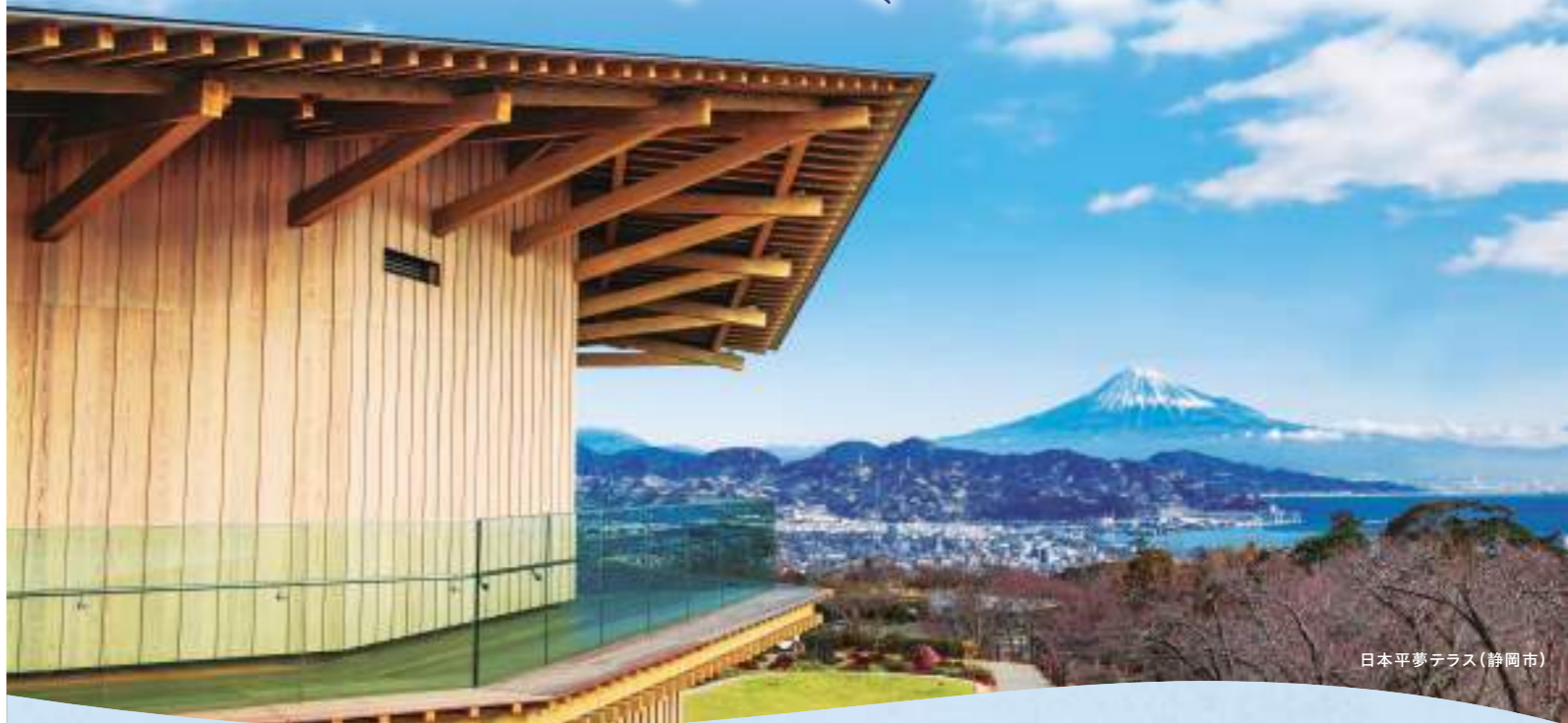
日本平夢テラス(静岡市)