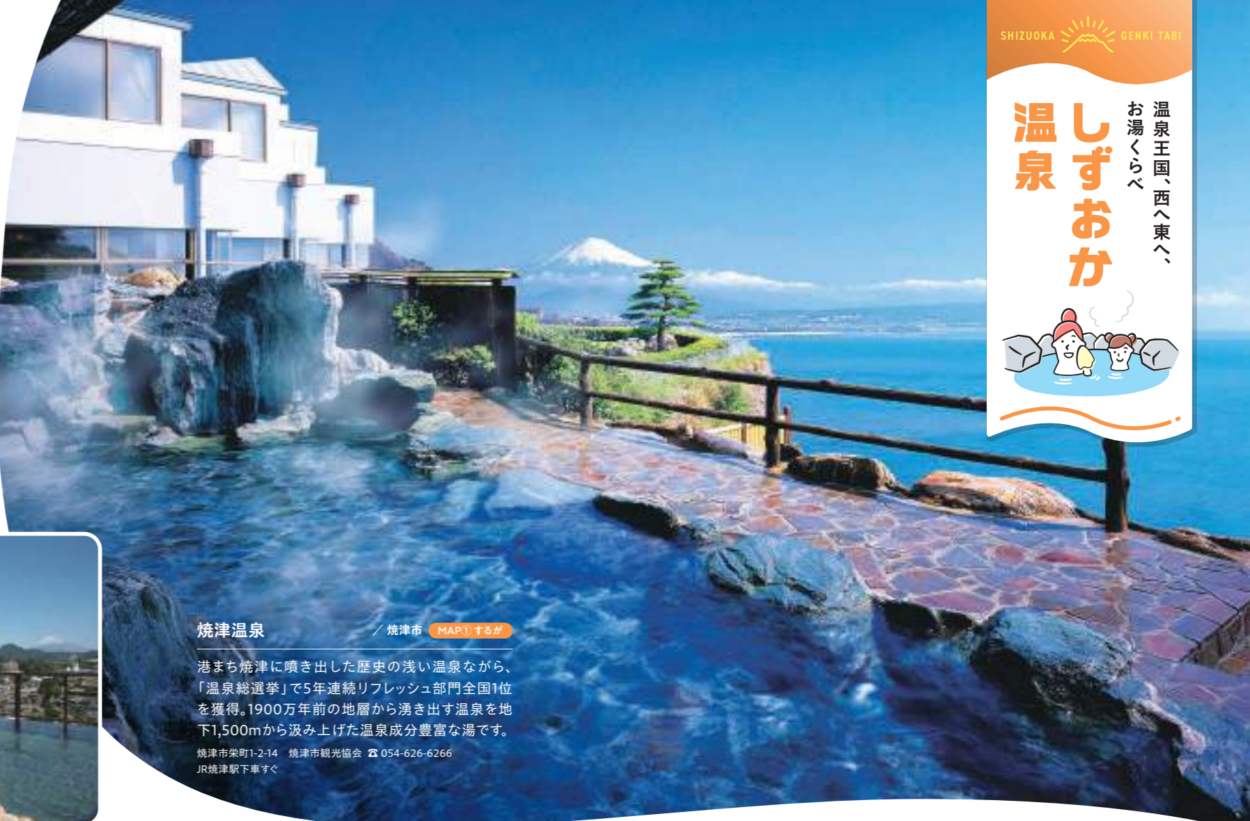
焼津温泉 / 焼津市 MAP① するが

港まち焼津に噴き出した歴史の浅い温泉ながら、「温泉総選挙」で5年連続リフレッシュ部門全国1位を獲得。1900万年前の地層から湧き出す温泉を地下1,500mから汲み上げた温泉成分豊富な湯です。 焼津市栄町1-2-14 焼津市観光協会 ☎ 054-626-6266 JR焼津駅下車すぐ