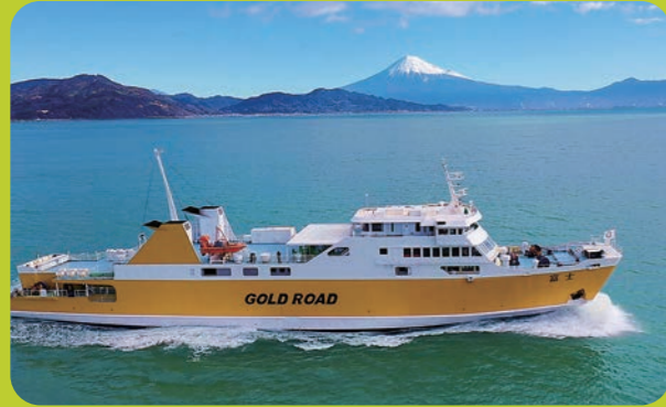
絶景の富士山を体験できるパノラマクルーズ 駿河湾フェリー(県道223号)