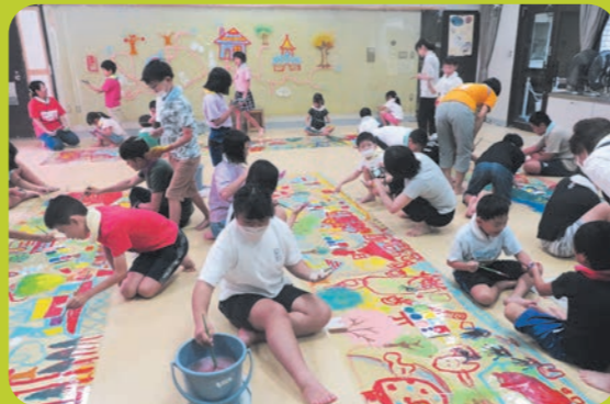
日本平のふもと、緑に囲まれた美術館 静岡県立美術館(静岡市)