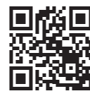
伊豆半島 ジオパークHP

伊豆半島ジオパークとは、ユネスコ世界ジオパークに認定された地球の驚異を体験できる自然豊かな地域です。壮大な地形、地質の謎、そして地域の文化を実感。伊豆半島で、私たちの地球との深いつながりを再発見しましょう。