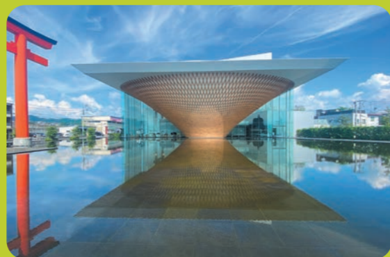
富士山の歴史や文化、自然について学べる施設 静岡県富士山世界遺産センター(富士宮市)