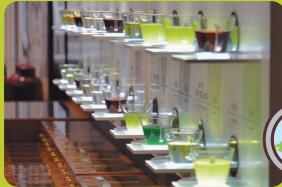
お茶の魅力を見て・触れて・味わう博物館 ふじのくに茶の都ミュージアム(島田市)