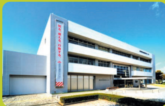
「知る・備える・行動する」がテーマの防災学習施設 静岡県地震防災センター(静岡市)