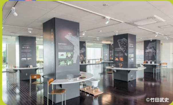
思考を拓くミュージアム ふじのくに地球環境史ミュージアム(静岡市)