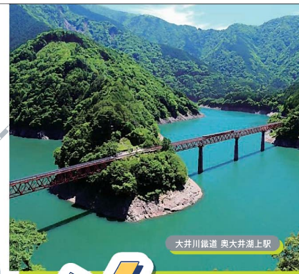
大井川鉄道 奥大井湖上駅