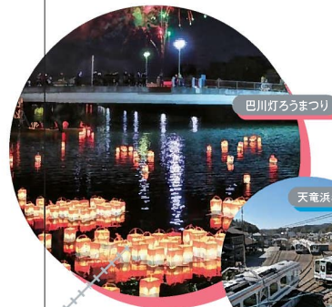
巴川灯ろうまつり