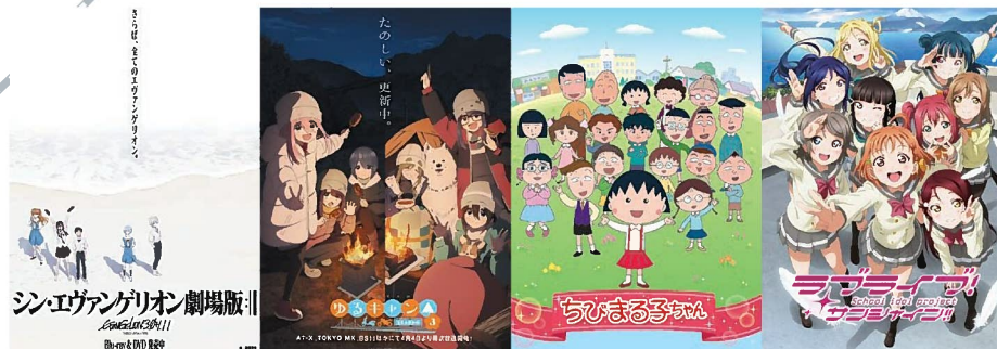
シン・エヴァンゲリオン劇場版