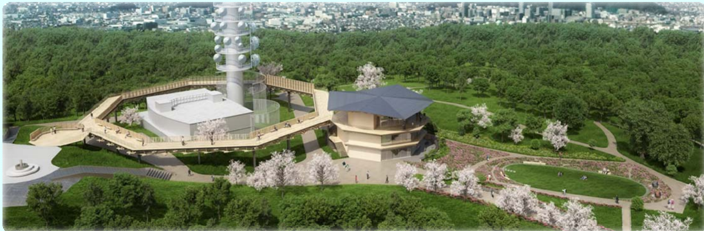
展望施設の完成イメージ

平成30年秋のオープンに当たり、多くの方に親しまれる施設となるよう、県と市の施設を一体的に呼称する愛称を募集します。