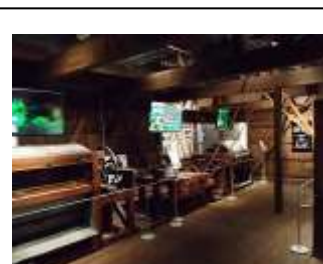
博物館 2 階展示室