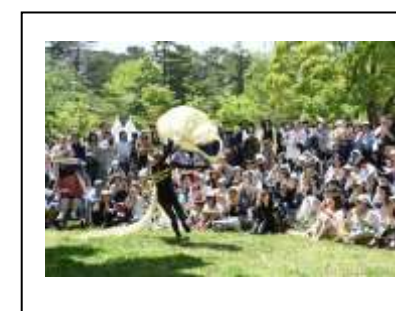
駿府城公園での無料 野外パフォーマンス