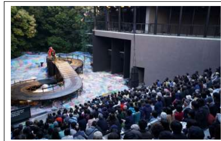
ふじのくにせかい演劇祭