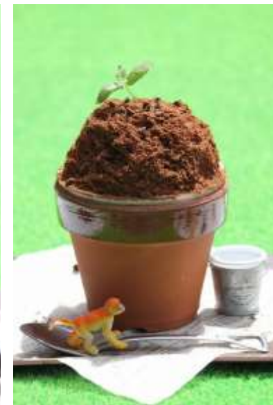
チョコシロップに ココアパウダーの「大地」