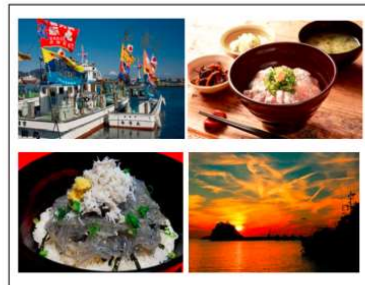
参加店舗一覧 (H30.9 時点) ※今後参加店舗が追加される場合があります。