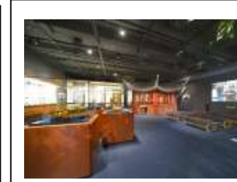
博物館 3 階展示室