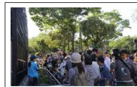
平成30年度 開催時の様子